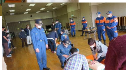
応急対応訓練（胸部圧迫法とAED使用法）