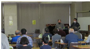
防災事務局・自治会会長挨拶