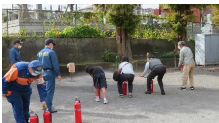
初期消火訓練・消火器使用時の注意事項他