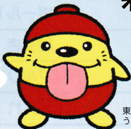
東大和市観光キャラクター うまべえ