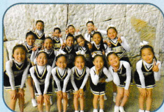
チアリーディングチームStars